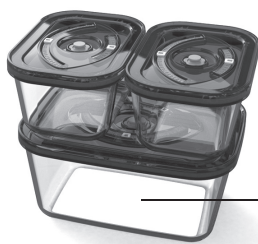
Контейнеры для вакуумирования (в комплектацию не входят, приобретаются отдельно)