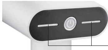
Сильная подача пара

Когда горит только левый индикатор — это означает, что установлен режим слабой подачи пара. Нажатием на кнопку «вкл/выкл», вместе с левым индикатором загорится правый индикатор — это означает, что установлен режим сильной подачи пара.