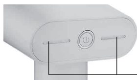
Сильная подача пара

Когда горит только левый индикатор — это означает, что установлен режим слабой подачи пара. Нажатием на кнопку «вкл/выкл», вместе с левым индикатором загорится правый индикатор — это означает, что установлен режим сильной подачи пара.