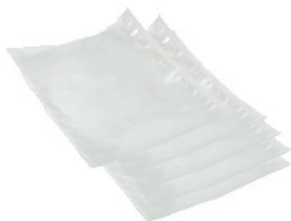
Пакеты для вакуумирования (5 шт.)