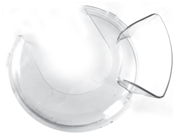
Крышка с загрузочной горловиной