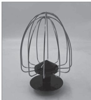
Венчик для взбивания