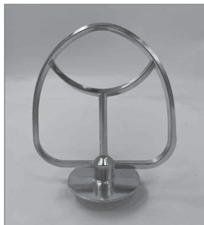
Насадка для смешивания