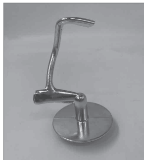
Крюк для замешивания

С помощью кнопки откидывания моторного блока можно откинуть моторный блок , чтобы установить или снять насадки и чашу . Загрузочное отверстие на крышке чаши позволяет добавить ингредиенты при установленной крышке без откидывания моторного блока.